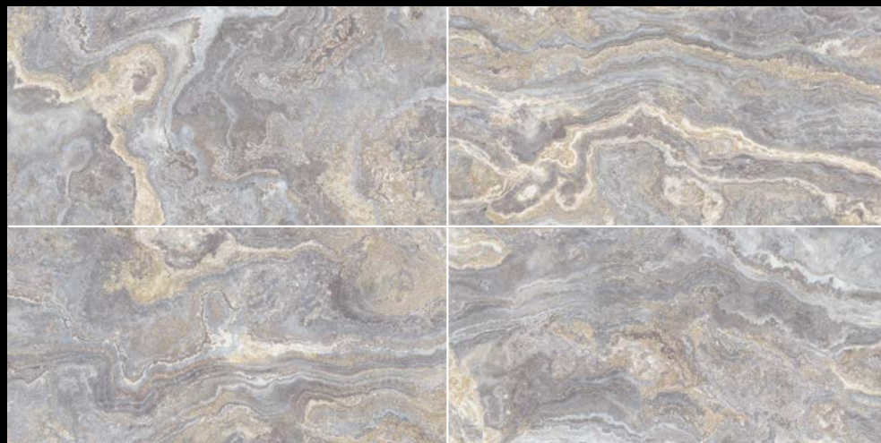
59 x 119 R 217410 M86