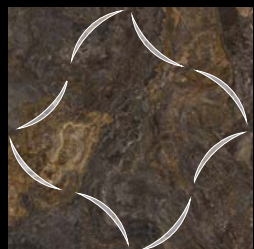
Rosetón Visual (Set 2pzs)