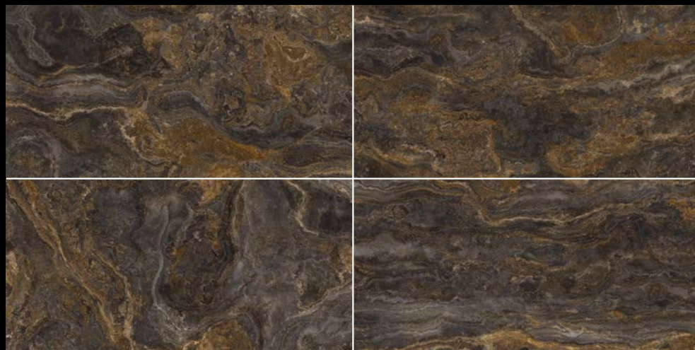
59 x 119 R 217409 M86